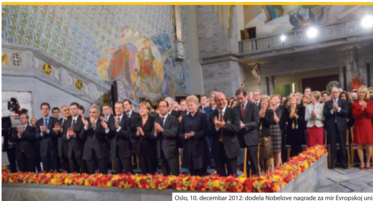
Oslo, 10. decembar 2012: dodela Nobelove nagrade za mir Evropskoj uniji